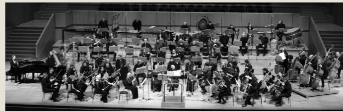
Εθνική Συμφωνική Ορχήστρα της ΕΡΤ

Έχει συμπράξει με τη Φιλαρμονική της Σλοβακίας, την Orchester'91 του Αμβούργου, τη Συμφωνική Ορχήστρα του Δήμου San Martín και του Πανεπιστημίου San Juan της Αργεντινής, τη Südwestfalen Γερμανίας, την Εθνική Συμφωνική Ορχήστρα της ΕΡΤ και την Κρατική Ορχήστρα Αθηνών, σε κορυφαίες αίθουσες, όπως: Kölner Philharmonie, Κρεμλίνο, Auditorio Juan Victoria (Αργεντινή), Beethovenhalle (Βόννη), Bundesverwaltungsgericht (Λειψία), Süreyya Opera House (Κωνσταντινούπολη), Εθνική Λυρική Σκηνή, Μέγαρο Μουσικής Αθηνών. Δραστηριοποιείται επίσης με ιδιαίτερη επιτυχία και στο ρεπερτόριο της μουσικής δωματίου, σε συνεργασία με σπουδαίους καλλιτέχνες και εμφανίσεις σε φημισμένα διεθνή Φεστιβάλ (Λουκέρνη, Άμστερνταμ, Βόννη, Μπόντρουμ), καθώς επίσης στο Διεθνές Φεστιβάλ Κλασικής Μουσικής Κυκλάδων και το Φεστιβάλ Αθηνών & Επιδαύρου.