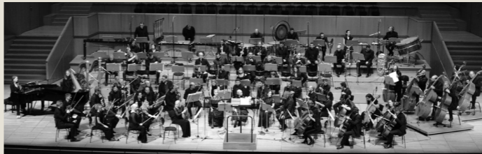
Εθνική Συμφωνική Ορχήστρα της ΕΡΤ

Έχει συμπράξει με τη Φιλαρμονική της Σλοβακίας, την Orchester'91 του Αμβούργου, τη Συμφωνική Ορχήστρα του Δήμου San Martín και του Πανεπιστημίου San Juan της Αργεντινής, τη Südwestfalen Γερμανίας, την Εθνική Συμφωνική Ορχήστρα της ΕΡΤ και την Κρατική Ορχήστρα Αθηνών, σε κορυφαίες αίθουσες, όπως: Kölner Philharmonie, Κρεμλίνο, Auditorio Juan Victoria (Αργεντινή), Beethovenhalle (Βόννη), Bundesverwaltungsgericht (Λειψία), Sŭreyya Opera House (Κωνσταντινούπολη), Εθνική Λυρική Σκηνή, Μέγαρο Μουσικής Αθηνών. Δραστηριοποιείται επίσης με ιδιαίτερη επιτυχία και στο ρεπερτόριο της μουσικής δωματίου, σε συνεργασία με σπουδαίους καλλιτέχνες και εμφανίσεις σε φημισμένα διεθνή Φεστιβάλ (Λουκέρνη, Άμστερνταμ, Βόννη, Μπόντρουμ), καθώς επίσης στο Διεθνές Φεστιβάλ Κλασικής Μουσικής Κυκλάδων και το Φεστιβάλ Αθηνών & Επιδαύρου.