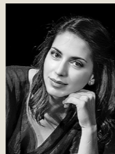
ΑΓΑΠΗ ΤΡΙΑΝΤΑΦΥΛΛΙΔΗ Πιάνο

(Ουγγαρία-Μάλτα-Αθήνα). Το 2011, κατόπιν ψηφοφορίας εκατό μουσικών διαφορετικών εθνικοτήτων, εξελέγη καλλιτεχνικός διευθυντής της Φιλαρμονικής Ορχήστρας του Κατάρ, ενώ επί σειρά ετών υπήρξε ο πρώτος μαέστρος της Φιλαρμονικής Ορχήστρας της Μάλτας. Είναι τακτικός προσκεκλημένος μαέστρος όλων των ελληνικών ορχηστρών και τουλάχιστον είκοσι διαφορετικών συμφωνικών ορχηστρών του εξωτερικού. Εκπροσωπείται από το κορυφαίο καλλιτεχνικό γραφείο IMG Artists και πραγματοποιεί περισσότερες από σαράντα συναυλίες ανά τον κόσμο ετησίως.